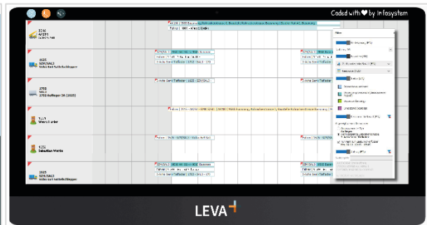
LEVA+ - Dispositionstafel mit diversen Filtermöglichkeiten (Alternative; plain)