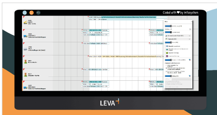
LEVA+ - Dispositionstafel mit diversen Filtermöglichkeiten

Die äußerst performante Dispositionstafel verfügt über zahlreiche Filtermöglichkeiten. Sie zeigt in Echtzeit den Einsatzstatus des Fahrers. Der Dispositionsplan ist sowohl browserfähig wie auch responsive.