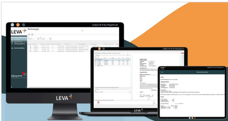
LEVA+ - Übersicht Multi-Device-Fähigkeit

Dabei ist LEVA+ nicht einfach eine Dispositionssoftware, sondern unterstützt von der Planung, über die Auftragsabwicklung, bis hin zur Leistungserfassung sowie Verrechnung als Gesamtlösung. Benutzerfreundlichkeit ist dabei ebenso wichtig, wie die Multi-Device-Fähigkeit.