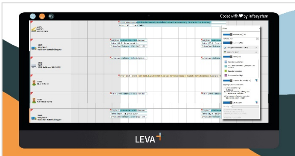
LEVA+ - Dispositionstafel mit diversen Filtermöglichkeiten